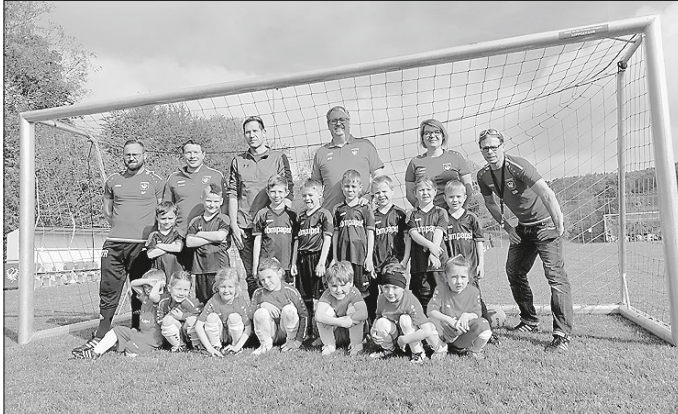
Trainer und Kinder warten voller Vorfreude auf den Anstoß