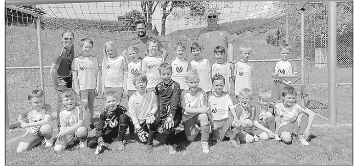
Unsere F-Jugend vor dem ersten Spiel