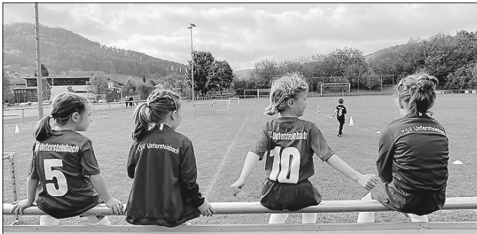
Vier unserer Mädels warten auf ihren Einsatz